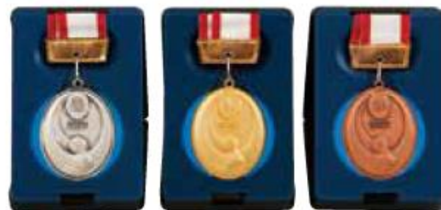
受賞者へのメダル

完成した作品は、校内にて各部門ごとに審査し、表彰式や展示会などを開催しています。なお、卒業論文・制作については、中学卒業時に成果を冊子として取りまとめ、中1から中3までの全員に配付しています。